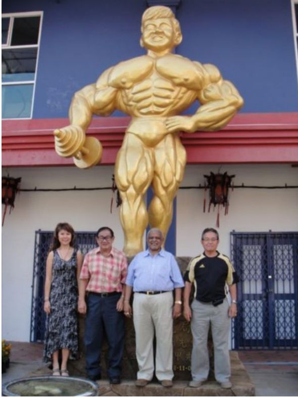
ပါဝင်သည့်ကိုယ်အလေးချိန်အတန်းဆယ်တန်းမှာ---